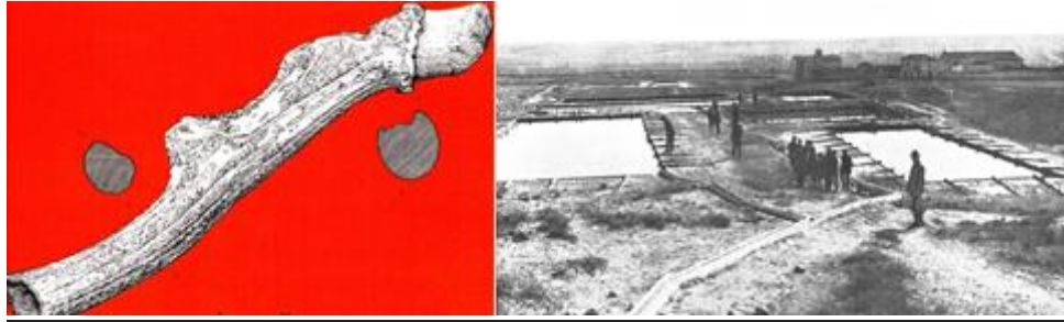
Pico-palanca, mina calcolítica del Milagro, Onís (Asturias) y Visita a las Salinas Espartinas con motivo del Congreso Geológico Internacional de 1926

Ciempozuelos (Madrid) 01 al 4 Octubre 2020